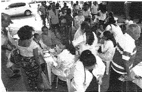
A ação levou atendimento para pessoas em situação de rua e a população em geral, na região central de São Luís

A unidade oferece tratamento diário à população com transtornos decorrentes do abuso e dependência de substâncias psicoativas